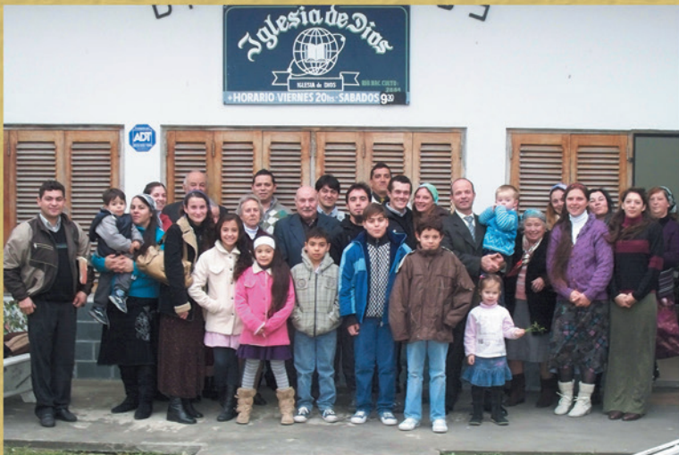
Congregación de la iglesia de Dios.