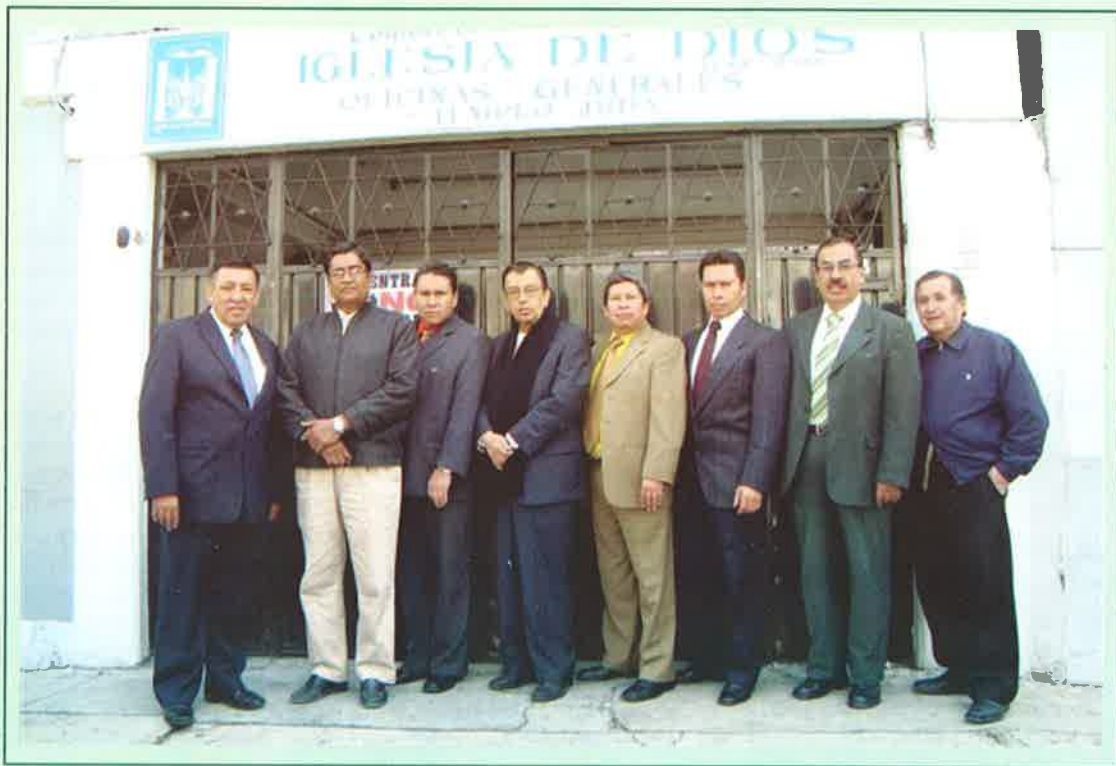
CONSISTORIO DE ANCIANOS REUNIDOS EN LAS OFICINAS DE LA CONFERENCIA GENERAL DE LA IGLESIA DE DIOS.