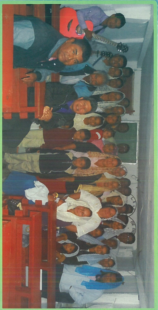
Congregación de “Tres Palmas” del Municipio de Temporal, Veracruz