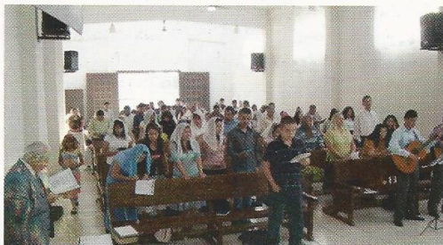
Reunión de avivamiento en Cuautla, Morelos