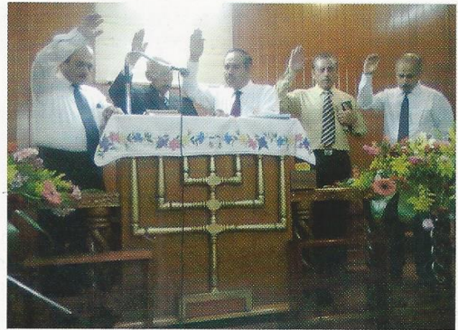
Ministros orando en Reunión Regional