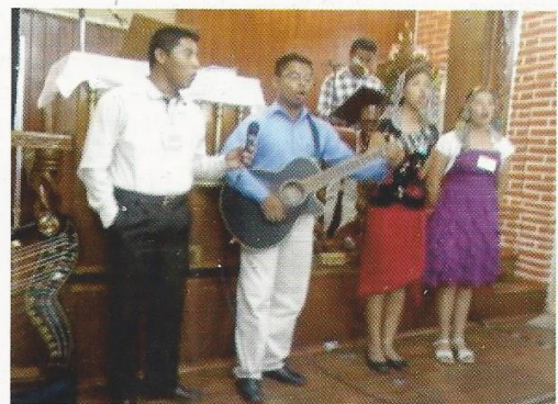
Reunión Regional en Merida, Yuc.